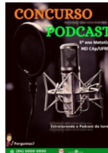
Folder do concurso

A edição foi realizada com a ajuda dos professores e do bolsista da componente curricular de EF utilizando um software livre, Audacity, a fim de tirar ruídos, corrigir erros técnicos e trazer uma melhor qualidade.