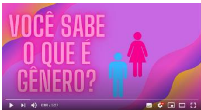
VÍDEO 1: GÊNERO, ESTEREÓTIPOS DE GÊNERO E SEUS EFEITOS NA EDUCAÇÃO FÍSICA ESCOLAR

A metodologia do trabalho foi desenvolvida a partir das atividades propostas no projeto original de modalidade presencial.