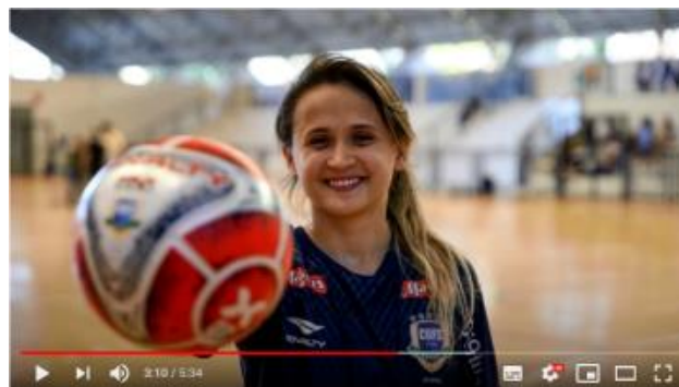
VÍDEO 2: FUTSAL E SUAS PROBLEMÁTICAS DE GÊNERO