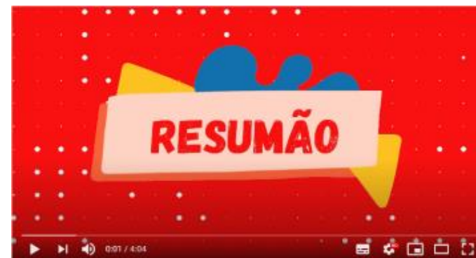
VÍDEO 3: RESUMO DOS VÍDEOS ANTERIORES + INSTRUÇÃO DA ATIVIDADE FINAL